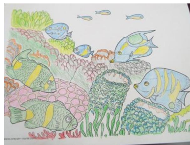
大人の塗り絵 ～夏バージョン～