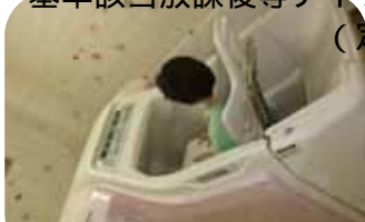
特殊浴でゆったり安心バスタイム