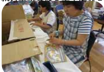
雑誌ふるく詰めのお仕事

きぼうの家 は、利用者・ご家族と連携し利用者個々のペースや目標に合わせて各自の適正に応じた指導を心がけています。農耕作業・創作活動・運動プログラムでは、利用者の体調や精神状態に添った、心身共に安定が図れるようサービスを提供しています。