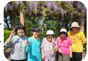
お待ちかねの社会見学