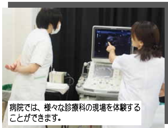
病院では、様々な診療科の現場を体験することができます。

昨年度の職場体験の様子です。昨年度は10名が受講し、9名が全課程を修了しました。