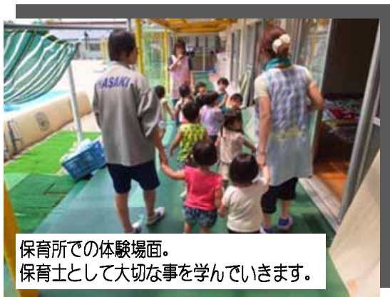
保育所での体験場面。保育士として大切な事を学んでいます。