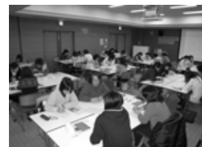
第4期研修会の様子

※11月11日（水）、12月2日（水）は、地域ネットワーク勉強会との合同開催となります。この研修会に申し込みされない方でも自由に参加できますので、お問い合わせの上ご参加下さい。