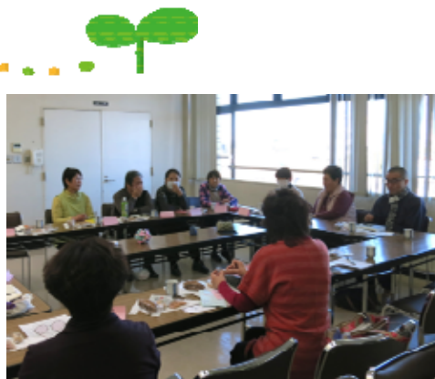
仲間の思いに耳を傾けます

【お問い合わせ先】神栖市社協神栖本所(保健・福祉会館内) 担当：名雪 電話：0299-93-0294