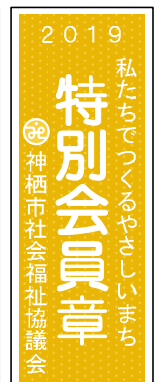
一般会員章 (赤) 特別会員章 (やまぶき色)