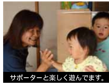
サポーターと楽しく遊んでいます。

それぞれお昼に休憩があります。昼食は各自でご用意ください。研修後に登録された方は、サポーターに同行し、活動前のサポート体験をしていただきます。