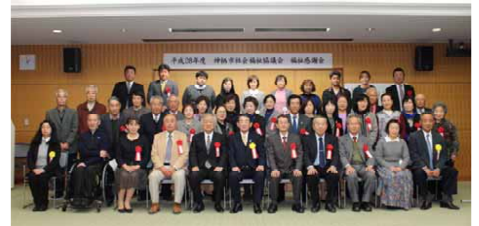
当日出席された受賞者の皆様で記念撮影

当日は「保育サポーターひよこ」さんによる託児を実施しました。ご協力ありがとうございました。