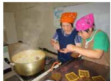
収穫祭でのカレー作り。使う野菜は、すべて農耕作業で収穫した自家製です。