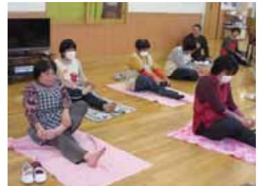
リラックスした雰囲気で行うヨガ体操。ボランティアさんが指導します。

利用できる方…市内在住の18歳以上の身体・知的・精神障害者で、障害福祉サービスの支給決定がされている方