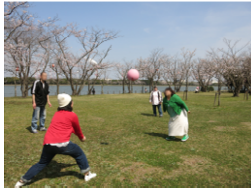
写真は、春恒例のお花見の一場面です。青空のもと、ほのぼのとソフトバレーをする参加者のみなさん。

自分のペースで活動時間や内容を選び、無理なく参加し、安心して過ごせるよう、作業療法士や精神保健福祉士がサポートします。精神保健デイケアに関心のある方は、お気軽にお問合せください。