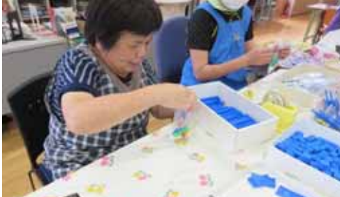
<内職作業> 作業に不安がある方には、職員がサポートします。

きぼうの家は、生活訓練や内職、農耕、縫製作業など働く喜びを通して、本人が自信を得られるよう支援する通所施設です。入浴、食事の提供はありません。