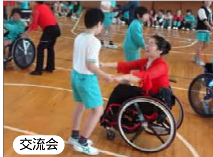
交流会 車いすダンスで交流。人との出会いの中で、お互いの理解が進みます。

神栖市社協は、市内の小中学校や企業、商店などで実施する「福祉教育出前講座」を実施しています。この講座は、交流や体験などのプログラムを通じ、お互いの違いを認め合い、相手に共感する力や自分の考えを表現する力とともに、その考えを実行する力などを身に付け、人への配慮を学びきっかけとなることを目的としています。