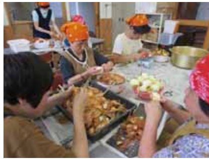
年間を通して様々なイベントがあります。この日は、自分たちで育て、収穫した作物を使いカレーを作りました。

就労継続支援B型...内職や布製品づくり、農耕などの作業訓練を実施します。ご自身のできることに応じ、多くの方が参加できるように、作業を細分化しています。