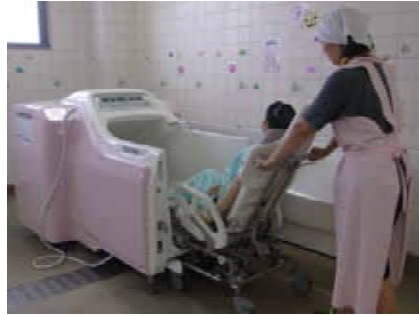
座ったままの姿勢で入浴できる浴槽。お湯は、お好みの温度に調節することができます。

“のぞみ”は、気管切開や経管栄養をされている方、たんの吸引が必要な方など、医療行為が必要な方にもご利用いただいています。医師の指示書に基づき、看護師が消毒や処置を行いますので、多くの方に安心・充実した一日を過ごしていただけます。