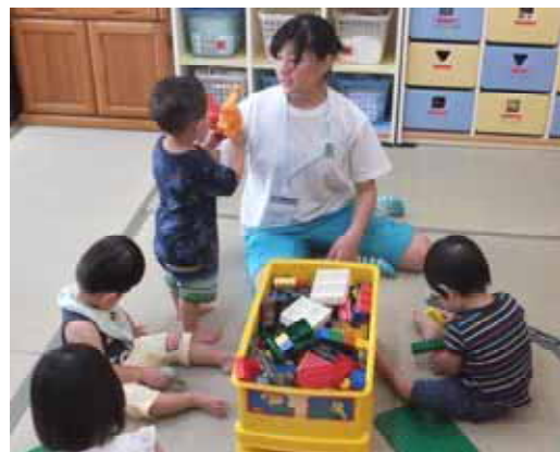
昨年度のアシストカレッジ 保育所での職場体験

福祉・医療の専門職には知識だけではなく、“利用者や患者と対話する力”や“場面を観察する力”、“自分が今何をすべきか考える力”などが必要です。この講座は、実際に専門職が働く現場で“専門職に必要な知識や技術とは何か”を学び、高校生のみなさんの職業選択や介護・医療の資格取得を目指す一助となることを目的としています。将来、看護師や歯科衛生士、理学療法士、作業療法士、保健師、保育士、介護福祉士、社会福祉士などの専門職として働きたいと考えている方はぜひご参加ください！