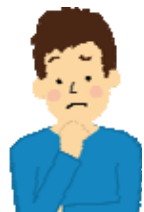
Bさん30歳 精神障害者

Bさんは、月1回病院(精神科)に通う以外の外出がほとんどなく、ひきこもり状態で、社会参加の第一歩が踏み出せませんでした。ご家族から、ひきこもり状態を改善したいと相談がありました。