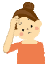
Aさん25歳 身体障害者

Aさんは特別支援学校卒業後に就職しましたが、職場の環境に馴染めず、退職してしまいました。母親から娘に再度就労に挑戦してもらいたいが、どのように進めてよいかかわからないとの相談が社協に入りました。