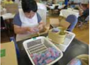
きぼうの家での生産活動のひとつ、内職。

内職や農耕、布製品づくりなど、働く喜びを感じられる活動が中心のプログラムです。就労継続支援B型利用者には作業実績に応じ、工賃が毎月支払われます。食事提供、入浴はありません。