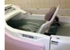
座ったままの姿勢で入れる特殊浴槽で、安心した入浴を提供します。

障害のある方が充実した一日を過ごしていただけるよう、座った姿勢・寝た姿勢のまま入浴できる浴槽を備え、仲間と一緒に楽しむ食事やレクリエーションなどを提供します。