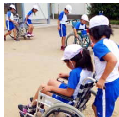
学校や企業で、車いす・高齢者疑似等の体験、地域の障害者・高齢者との交流によって、地域の生活者の思いを心と体で感じるための取り組みです。