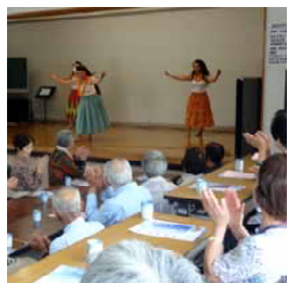
ボランティアによるおいしい食事や演芸を楽しみ、参加者同士の親睦を深められる、一人暮らしの高齢者を対象とした会食会です。