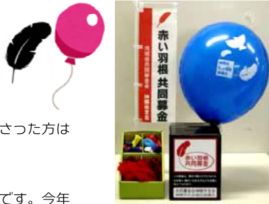
「赤い羽根共同募金」の小さなのぼり旗が目印です。