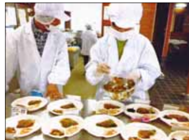
施設での昼食は当番を決めて自分たちで準備します。