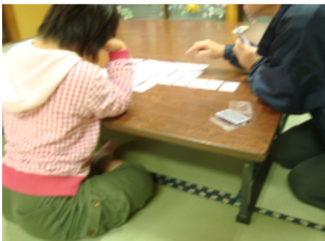
上：日中一時支援事業を行っているあすなる集会所（神栖市溝口） 下：日中一時支援事業の様子。この日はトランプを楽しみました。

これからも障害児者とそのご家族の気持ちに寄り添い、家族の目線を忘れずに事業展開していきたいと考えています。