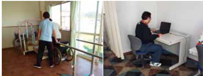
歩行訓練の様子 自由に使えるパソコンを常設

障害のある方で自宅に閉じこもりがちの方はたくさんいらっしゃると思います。その方々の毎日を、晴れやかにするお手伝いをしたいと考えています。