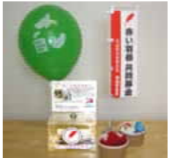
募金箱の設置期間は12月31日までです。募金された方は赤い羽根、風船をどうぞ。

※かみす社協ニュース平成26年10月号に掲載した設置店に加え、(株)鹿島臨海スポーツ 様(筒井1383)に募金箱を設置させていただきました。ご協力ありがとうございます。