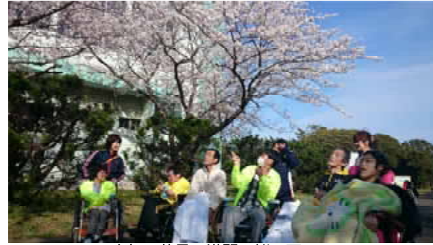
今年の花見。満開の桜の下で。

デイサービスセンターのぞみは、入浴・食事・健康管理などの基本サービスはもちろん“おいしい・楽しい・居心地いい”を感じていただけるよう、芸術祭や初詣などへの外出、お風呂も菖蒲湯やゆず湯など、一年を通じて楽しめるプログラムを揃えて、皆様をお迎えしています。