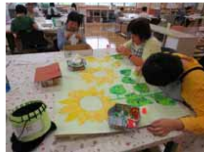
創作活動(ちぎり絵)