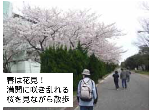
春は花見！ 満開に咲き乱れる桜を見ながら散歩

活動は、作業療法士(精神科)や精神保健福祉士、社会福祉士などの専門スタッフが担当しています。