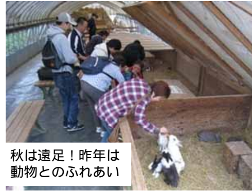
秋は遠足！昨年とは動物とのふれあい

病気から来る生活のしづらさや悩み事など、同じ病気を抱えている仲間だからこそ解り合えます。デイケアでの活動を通して、他の人との関わりや病気との付き合い方を学び、生活のリズムを整え社会参加のための一歩を踏み出してみませんか？