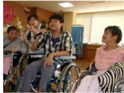
みんなで熱唱。カラオケは人気のプログラムです。

正直、初めての利用日は不安がありました。でも、以前から利用している方が声をかけてくれて、安心したことを覚えています。その方とは今でも同じ利用日に、楽しく過ごしています。 食事が一番の楽しみです。特にバイキングの時は10品目くらいから好きなものを選ぶことができるので気に入っています。いろいろあるメニューの中で、オムライスが一番好きです！ 今年の神之池の桜は最高でした。一人で出かけることが難しいので、外出活動は楽しみの一つです。 体調が崩れやすいので短時間で利用しています。ゆったり入れるお風呂は格別です。お風呂は他の人と一緒に入ると思っていたのですが、カーテンで仕切られていて人に見られることなく安心しました。もっと早く利用すればよかったなぁと思いました。