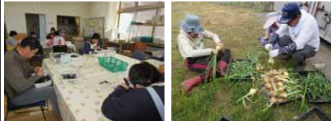
生産活動のひとつ、ゴム製品のバリ(余分な部分)取り。利用者それぞれができることを担い、製品をつくります。 農耕作業。農園で季節の野菜をつくり、販売します。とれたての旬の野菜は新鮮そのもの！です。

場所：神栖市溝口1746番地1 開所時間：月曜日～金曜日 午前9時～午後3時 ご希望により、送迎を行います。