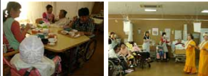
お楽しみの昼食。おいしさに加え、栄養バランスも考えられています。介助が必要に応じて付きます。 午後のレクリエーション。この日はボランティアさんによるフラダンスを鑑賞しました。