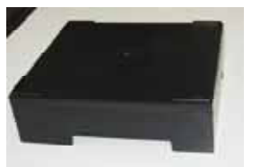
梱包箱(プラスチック製)の大きさは縦22cm x 横25cm x 高さ7.2cmです

今回は同社で使用した梱包箱を、社協善意銀行を通じ、障害福祉サービス多機能型事業所『ハミングハウス』へ提供しました。今後は雑巾の生産に使用する刺しゅう糸の仕分け箱として再利用されます。同社では「ハミングハウス様の全員で助け合いながら生産する姿勢は、改めて大切な事と認識する機会となりました。今後とも地域社会と、より良い繋がりを築きたい」とのことでした。施設・学校・保育所などで箱をご希望の場合は下記へご連絡ください。