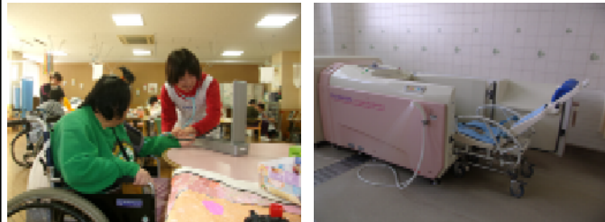
デイサービスセンターに到着。看護師が体温、血圧など、入浴の前その日の体調をチェックします。 座ったまま入浴できる浴槽。ご自宅での入浴が困難な方でもゆつりとお風呂に入れます。

場所：神栖市溝口1746番地1 (神栖市保健・福祉会館 新館1階) 開所時間：月曜日～土曜日 午前9時30分～午後3時30分 ご希望により、送迎を行います。