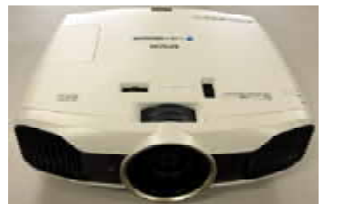
お寄せいただいたプロジェクター