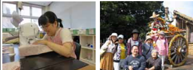
ミシンを使った製品づくり。刺しゅう入りタオルや雑巾、バッグなどの布製品を製作しています。 生産以外の活動も盛りだくさん！上の写真は社会見学で外出した時の思い出の一枚です。