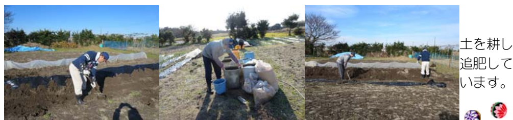
土を耕し追肥しています。

農耕活動が大変な季節ですが、寒さに負けず頑張っています。今月は玉ねぎ、ニンニク、エシャレットなどの追肥や、先月種まきをしたエンドウ豆の間引きを行いました。春に沢山の花が咲いて、おいしいエンドウ豆の収穫が楽しみです。