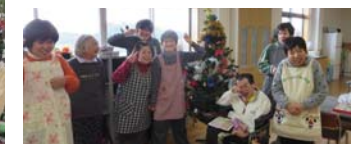
作業所内に飾られているツリーはみんなの力作です。