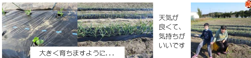
天気良くて、気持ちがいいです