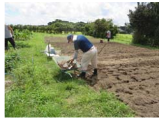
エシヤレットの畝作りの準備をしています