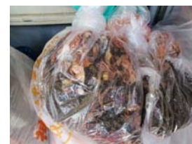
今年も有機肥料を頂きました。 有り難うございます。