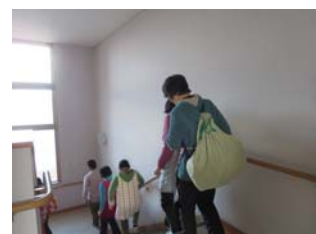
非常持出袋を背負って