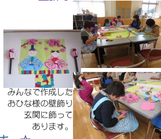
みんなで作成した おひな様の壁飾り 玄関に飾って あります。