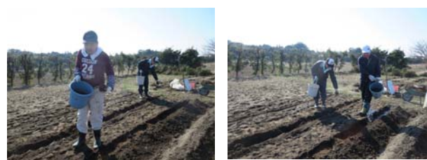
畝を作り肥料を蒔いています

EMボカシ肥料によって、農園の土もだいぶフカフカになりました。 畝作りも楽々です。