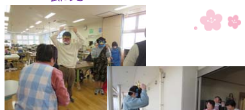
みんなで「鬼は外ー！福は内ー！」と 大きな声で豆をまきました。