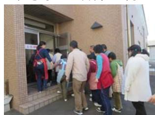
津波が来る想定で 福祉会館2階に避難しました

平成23年3月11日(金)に発生した東日本大震災から5年になります。 きぼうの家では、毎月11日を避難訓練の日と決め、迅速に避難が 出来るよう訓練を行っています