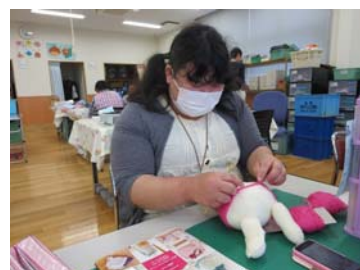
Mさん かぎ針で編んだシュシュや 編みぐるみが大人気です。

この「編み物」は編み目が勝負。余所見して、一目を飛ばしてしま うと途中までほどいて編み直しです。集中して作業します。 夏用のシュシュも有りますが、この暑い夏から冬用の製品を製作 しています。