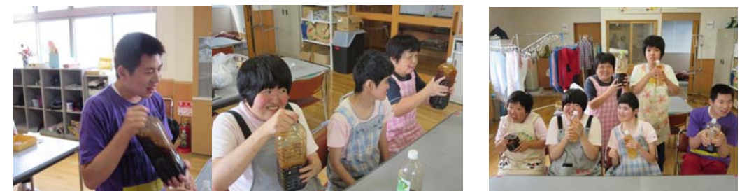
ひたすら シェイク シェイク シェイク