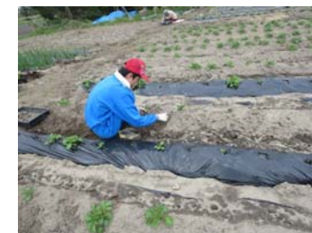
ジャガイモの芽が出てきました