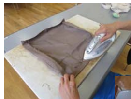
アイロンをかけて マチを作ります