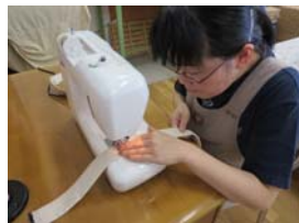
持ち手を縫製 中です