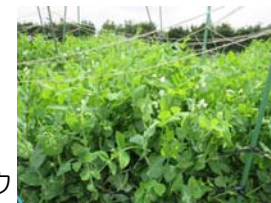
もうすぐ収穫 スナップエンドウ