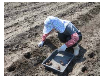
サトイモの植え付け