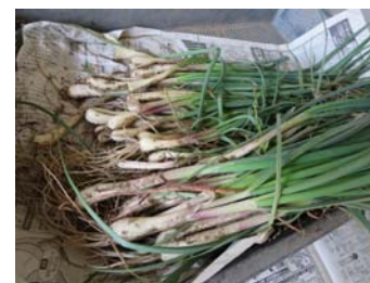
エシャレット初収穫