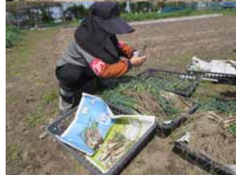
種芋にと保存していた里芋を 植え付けに備え掘り起こしています