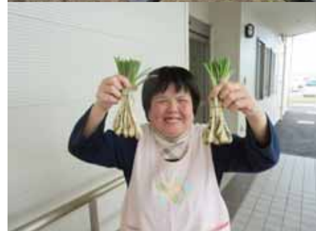
こんなに立派に育ちました