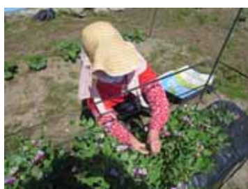
エンドウ豆の収穫も始まりました