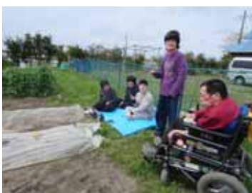
作業を見守っています