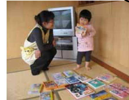
どれにしようかなあ～