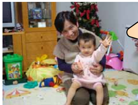
はい！兼城サポーターのおひざの上 一番のお気に入りかな*