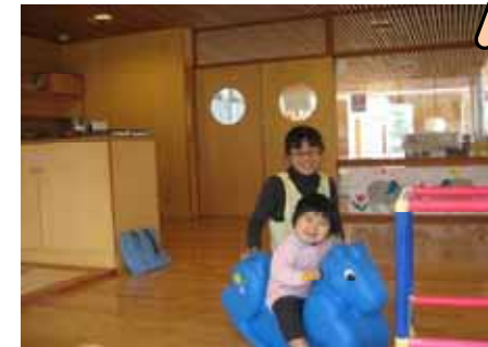
元気いっぱいのかちゃんです