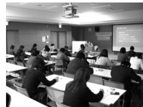
第3期研修会の様子

※11月12日(水)、12月11日(木)は、地域ネットワーク勉強会との合同開催となります。この研修会に申し込みされない方でも自由に参加できますので、お誘い合わせの上ご参加下さい。