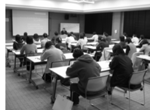
第2期研修会の様子

※11月7日(水)に限り、第121回地域ネットワーク勉強会との合同開催となります。この研修会に申し込みされない方でも自由に参加できますので、お誘い合わせの上ご参加下さい。