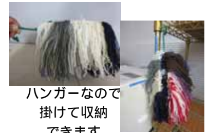
ハンガーなので 掛けて収納 できます

製作物はきぼうの家、市障がい福祉課、ボランティアセンターでお求め頂けます。 是非きぼうの家の製作物を手にして見てください。