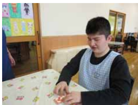
ゴムを伸ばして 手を離すと ぴょーんと跳ねます