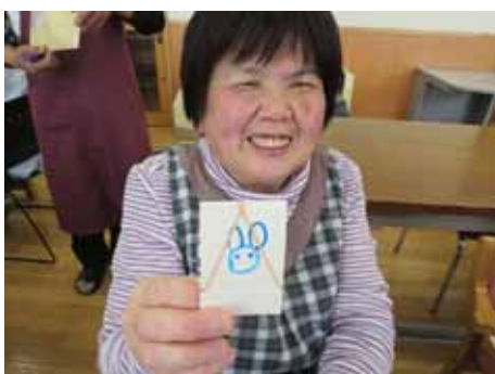
好きな動物の絵を描いて