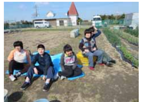
ニンジンの種を蒔きました ちょっと 休憩 天気がいいと気持ちが良いですね