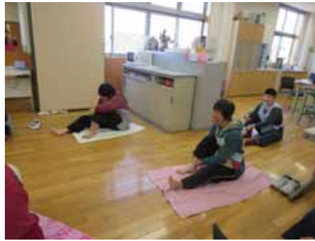
シュシュシュー リンパの流れを良くしています