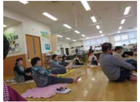
倒れないようにね がんばってー

～ 童心に返って 神之池散策 ～ 寒さも吹き飛ばす位に楽しみました みんなも笑顔です