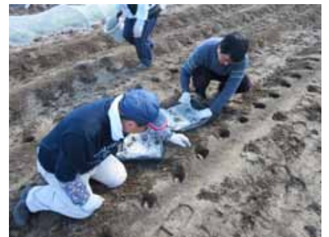
ジャガイモの植え付け 大きくなーれ！