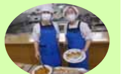
まごころ込めてます