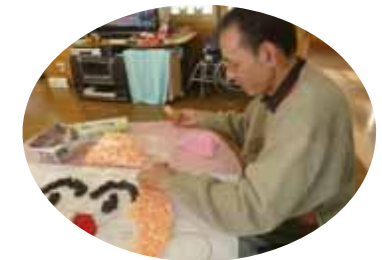
おりがみなどは制作活動に使用します