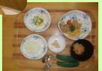
きざみ食と自助皿・自助具

【生活介護】 自立した日常生活や社会生活を営むことが出来るよう、常時支援を必要とする障害のある方に、入浴や排泄、食事の支援や生活等に関する相談・助言、創作活動等の機会を提供し効果的におこなえるよう活動しています。(利用の条件:市内にお住まいの障害支援区分3以上の方 利用定員20名)