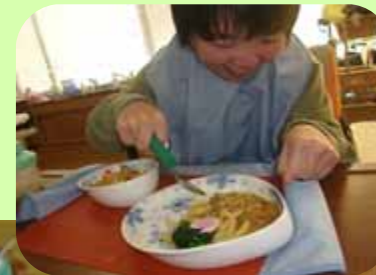
スプーンの柄にスポンジ ハンドルを装着 握りやすさがアップ

のぞみではきざみ食やミキサー食など、嚙む力や飲み込む力にあわせたお食事を用意しています。家庭的な手作りのお食事を、ご自身の持てる力を活かした自助具や食器で楽しく、召し上がっていただいています。