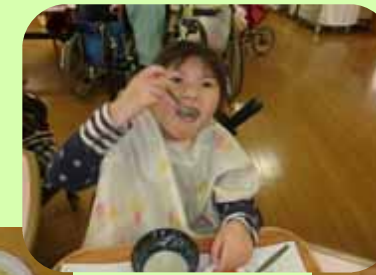
自分で食べると おいしさ倍増