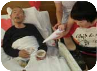
日頃の感謝をこめて