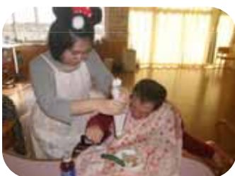
バレンタインクッキング