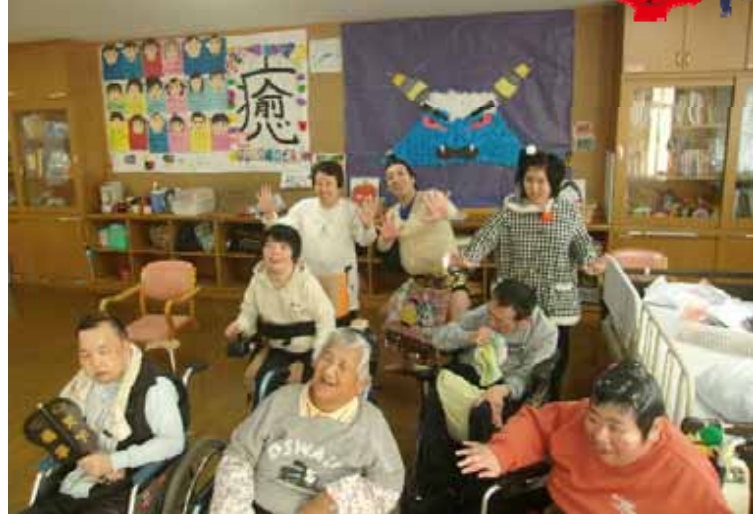
のぞみ部屋 大集結

茨城出身の横綱誕生に、のぞみでも”すもう人気”が盛り上がっています。2月3日の節分には横綱??が訪れ、奉納土俵入りを披露しました。