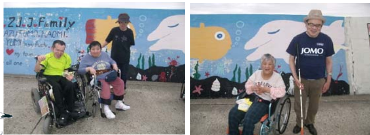
かわいい絵の前でポーズはOK?

また、7月8日には「ドンキホーテ」に外出しました。店内ではボランティアさんとショッピングしたりジュースを飲んだりと交流しながら楽しい時間をすごしました。