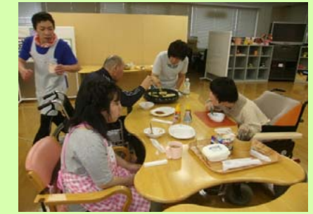
ホットプレートでお楽しみクッキング

【生活介護】自立した日常生活や社会生活を営むことが出来るよう、常時支援を必要とする障害のある方に、入浴や排泄、食事の支援や生活等に関する相談・助言、創作活動等の機会を提供し効果的におこなえるよう活動しています。(利用料金:世帯の収入・障害支援区分によって異なります。)