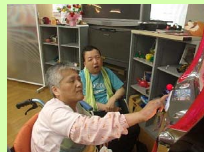
スロットを楽しんでいます

のぞみは神栖市保健・福祉会館の一角に位置しています。ルームの他に訓練室や食堂・浴室・相談室等広いスペースがあります。利用者さんはほとんどの時間を仲間とルームで過ごしますが、個別で活動したい時は、まったり広場(食堂)を利用します。読書やゲーム・一人でTVをみたりと個人的な時間を過ごせるようになっています。また、時にはみんなで楽しみクッキングをおこなったりもしています。