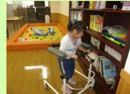
本も自由に選べます