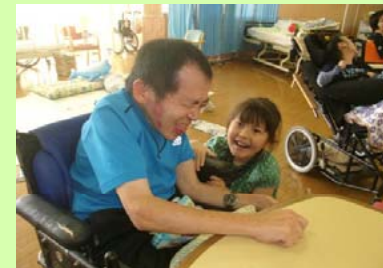
一緒に遊んで お兄ちゃん

【生活介護】 自立した日常生活や社会生活を営むことが出来るよう、常時支援を必要とする障害のある方に、入浴や排泄、食事の支援や生活等に関する相談・助言、創作活動等の機会を提供し効果的におこなえるよう活動しています。（利用の条件:市内にお住まいの障害支援区分3以上の方 利用定員20名）