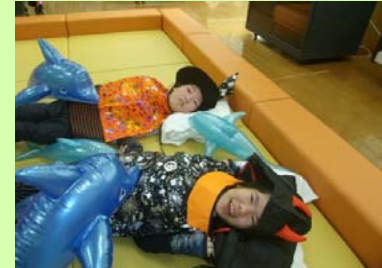
トリック オア トリート ハロウィン仮装はばっちり