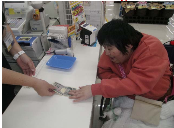
ちゃんと予算内で買えたよ！

10月25日に新しく出来たショッピングモールに行ってきました。たくさんのお店があるので、どこで買うのか、なかなか決められなかったようです。でも、ショッピングモールに着くとまっすぐに洋服や靴のお店をめぐらせる方、今日の晩ごはんのおかずを買う方、カフェでゆっくりする方など思い思いの時間を過ごされていました。