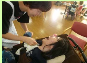
来所後看護師がバイタルチェックをおこないます。

放課後等デイサービスは、特別支援学校に通う重症心身障害の児童・生徒さんが対象で、学校がお休みの土曜日と祝日・夏休みや冬休みなどにご利用いただけます。生活介護で利用されている方と同様の食事介助、排泄介助、希望の方には入浴（有料）などのサービスを提供しています。