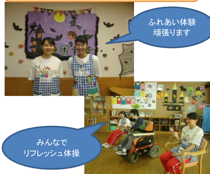
ふれあい体験 頑張ります