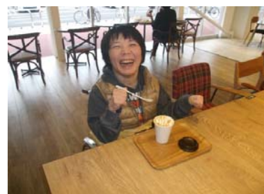
優雅にティータイム