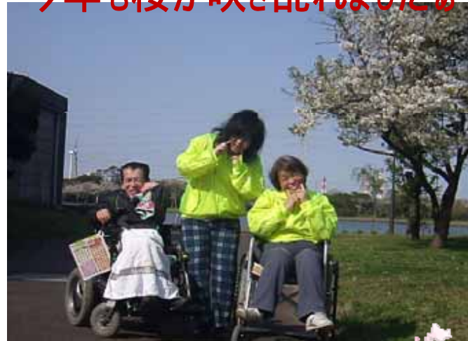
気持ちがいいと心はずみずみ

恒例の神之池のお花見。今年も見事な桜が咲き みんなで楽しいひとときをすごしました。 まだまだ風が冷たく肌寒くはありましたが、 満開の花の下、お散歩し心も身体もリフレッシュ できた一日でした。 のぞみのルーム・廊下・浴室、そしてお食事も 桜ご膳とお花見気分が盛り上がりました。