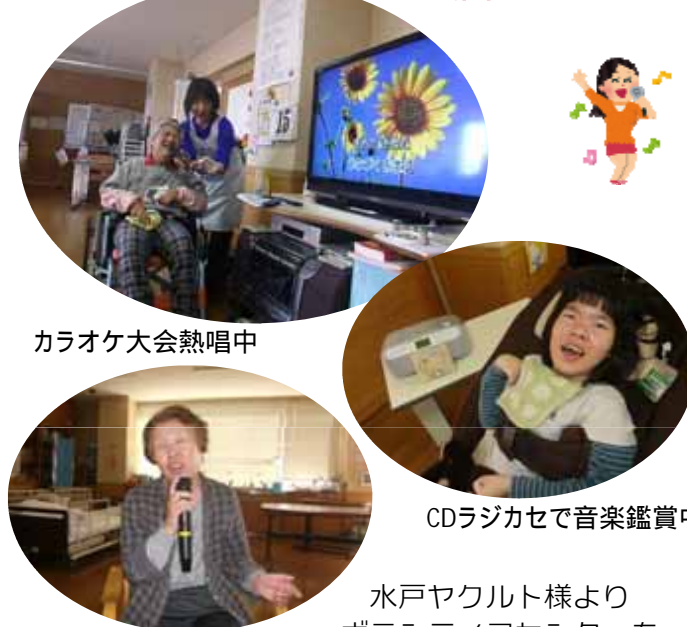
カラオケ大会熱唱中