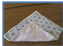
時間を忘れてチクチク・刺し子で作ったぞうきん