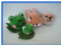
ボンボン細工で作ったキーホルダー