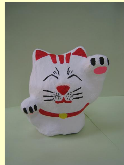
デイケア活動で作成した 張り子の『招き猫』