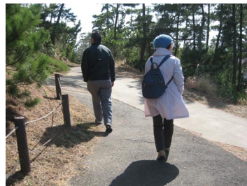
ウォーキング 土合散策