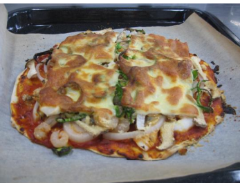
おやつ作り「簡単クリスピーピザ」