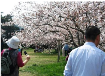
弁天公園でのお花見